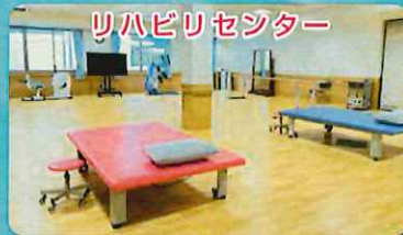
リハビリセンター