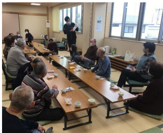
令和2年11月11日開催の様子。牛島地域包括支援センター南寿園職員より消費者被害についてのお話。

また、こちらのサロンは子育て中の親子も参加可能、老若男女問わないとのことですので、地域住民の皆様、ぜひ足を運んでみてはいかがでしょうか。