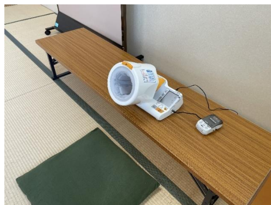
自由に血圧測定できます。